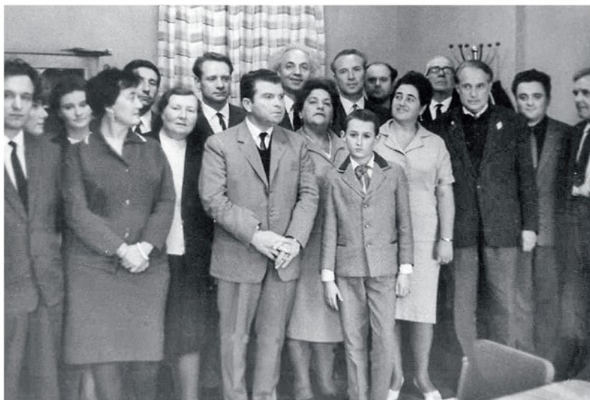
1985 год. Эмиль Гилельс (в центре) среди сотрудников Одесской консерватории