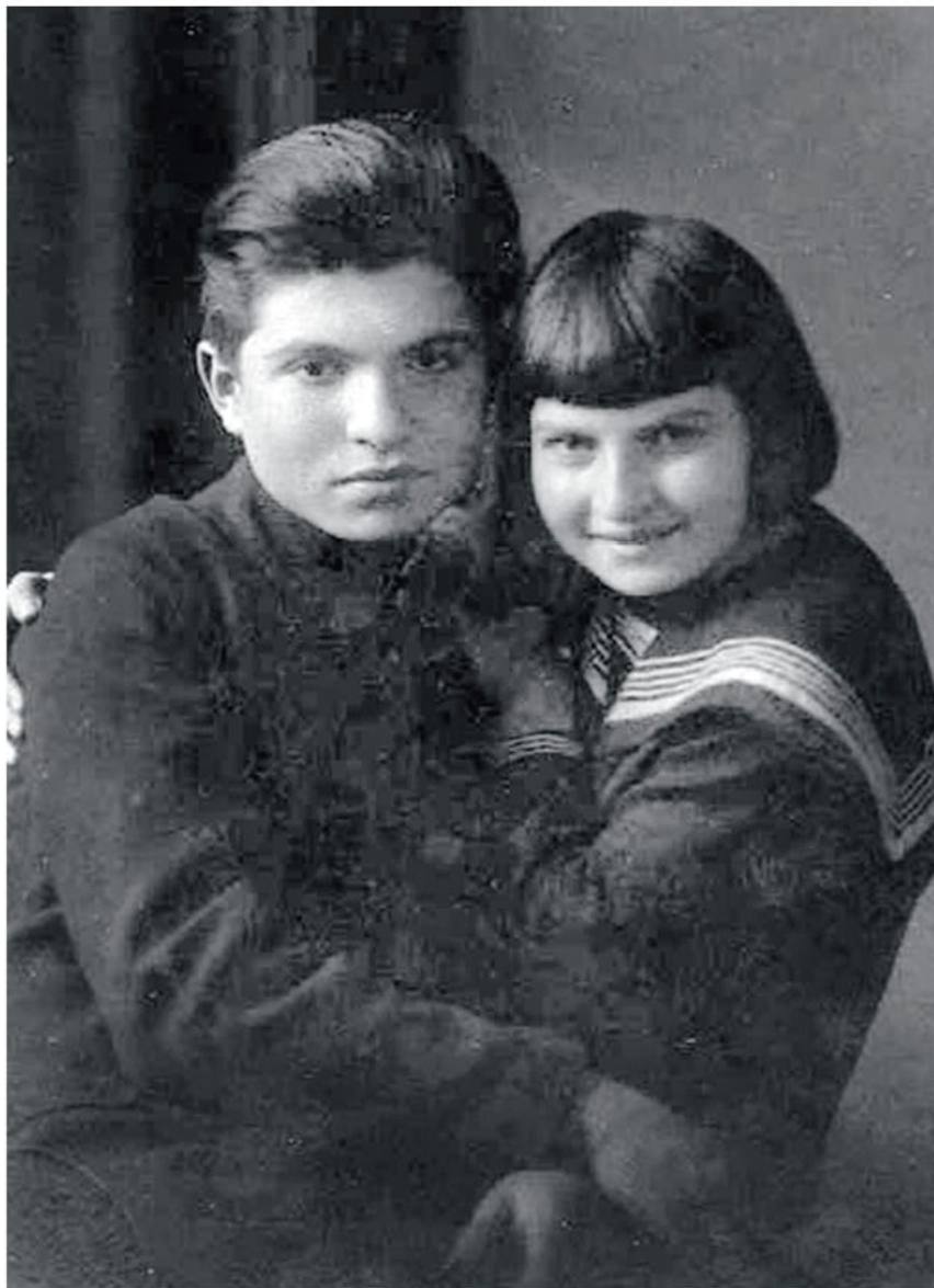
Эмиль и Елизавета Гилельс

«Марик, ты будешь играть скрипочка или ты будешь играть фут-